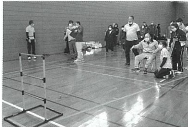
▲新種目 ラダーゲッター

2月23日に丸山総合体育館小アリーナで令和5年度福祉パラスポーツフェスタを開催し、町内の障がい者、ボランティア、福祉関係者、住民、上市高等学校ティーンボランティアサポーターが一堂に会しました。昨年に引き続き、富山県障がい者スポーツ指導者協議会指導員の皆さんご協力のもと、今回は新種目ラダーゲッターにも挑戦し、大いに盛り上がりました。町内福祉施設による商品販売もあり、楽しくふれあいながら、お互いの多様性への理解を深めあう大変有意義な時間となりました。今後もパラスポーツを通じたふれあい交流を促進していきます。