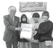
▲相ノ木小学校引渡式