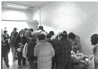
▲商品販売も大盛況でした