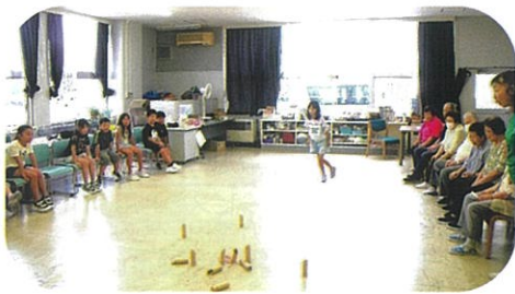
上市中央小学校児童とのモルック交流会

今回はさらなる事業の充実を目指し、「おたっしゃ家」を改名し、新しい愛称を募集いたします!