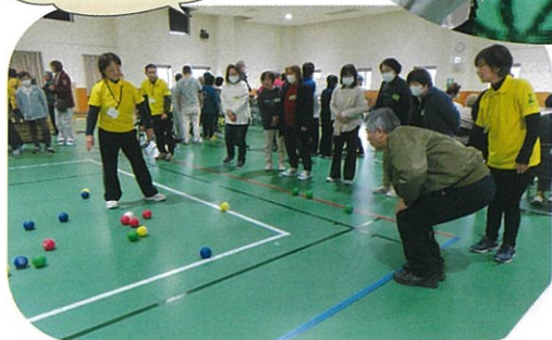
スクエアポッチャ