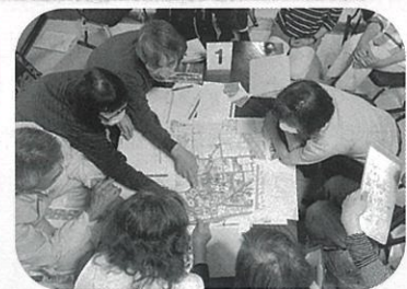
災害時支えあいマップの作成