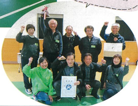
卓球バレー優勝チーム 「相ノ木地区社協」