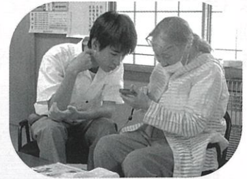
スマホサポーターによる 出張スマホ教室