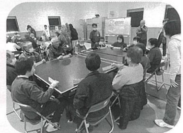
福祉パラスポーツフェスタ