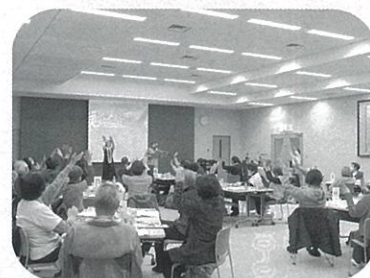
ボランティア養成事業の促進